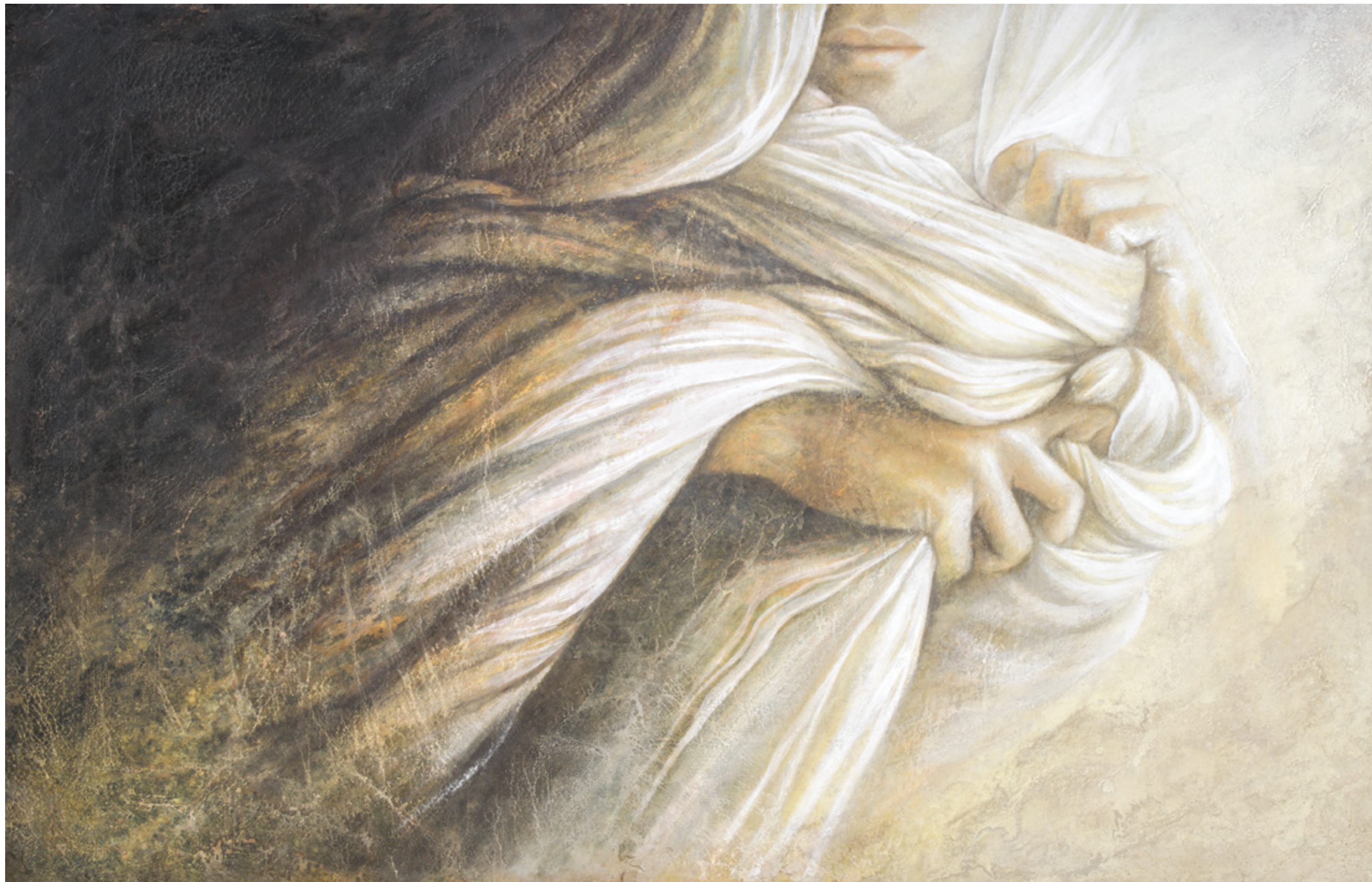
Prima Luce V , pigmenti di terre ed ossidi su stucco ed affresco / earth pigments and oxides on plaster and fresco, cm. 130x90, 2015