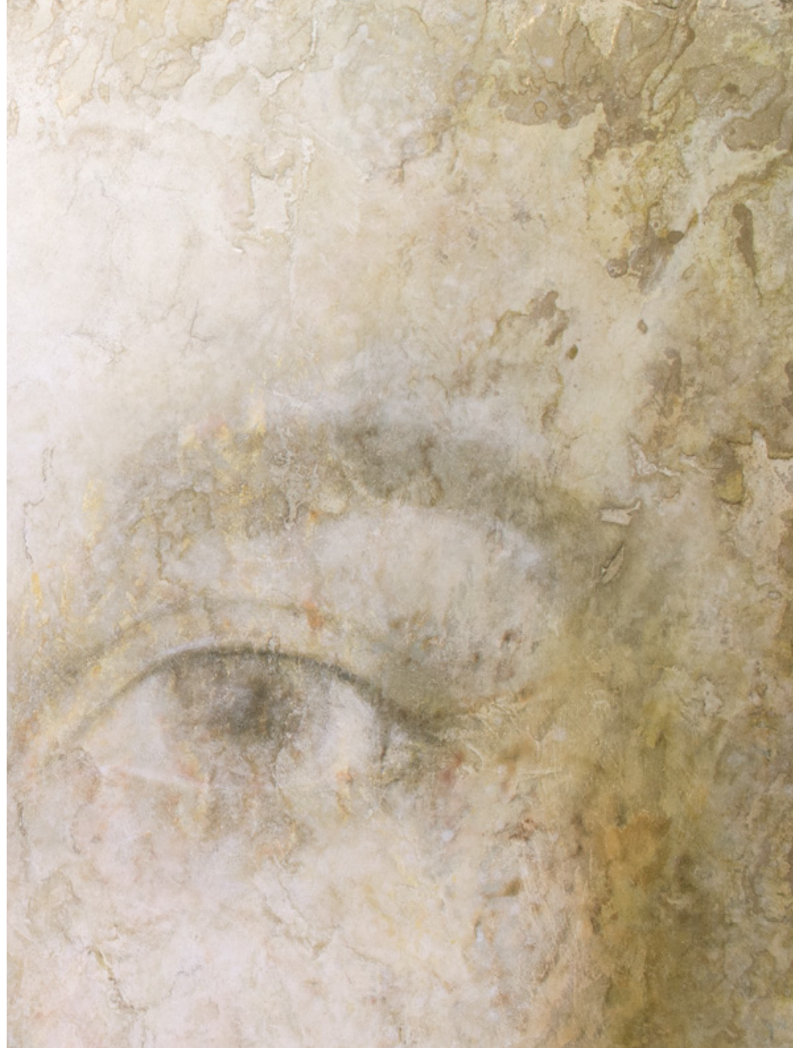
Prima Luce IX , pigmenti di terre ed ossidi su stucco ed affresco / earth pigments and oxides on plaster and fresco, cm. 150x200, 2015