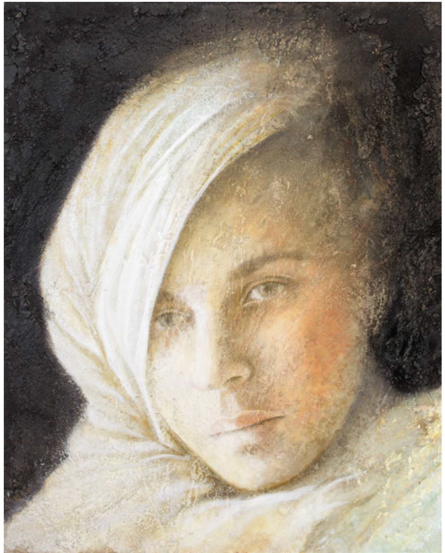
Prima Luce II , pigmenti di terre ed ossidi su stucco ed affresco / earth pigments and oxides on plaster and fresco, cm. 48x60, 2015