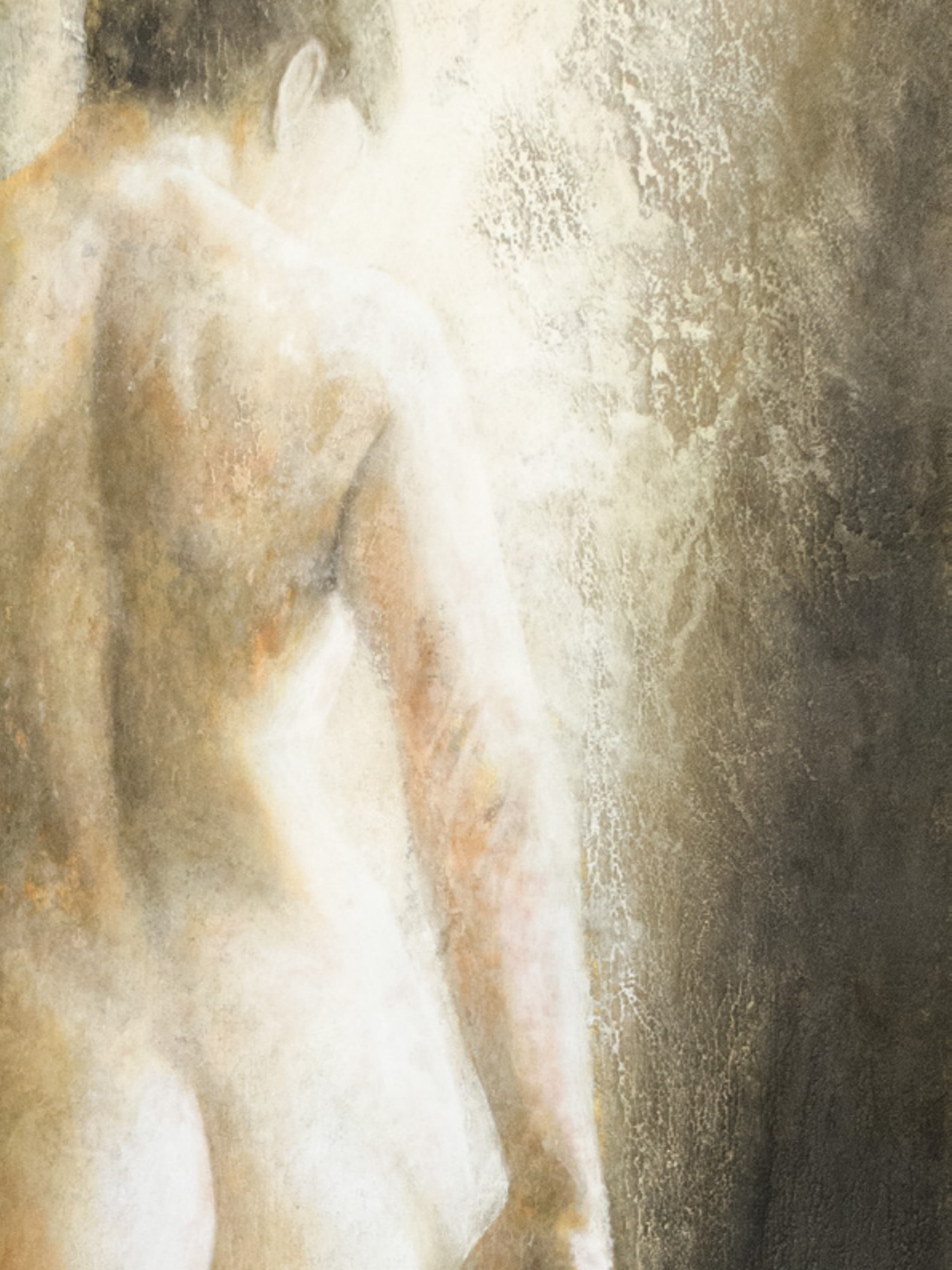
Prima Luce XI , pigmenti di terre ed ossidi su stucco ed affresco / earth pigments and oxides on plaster and fresco, cm. 78x180, 2015