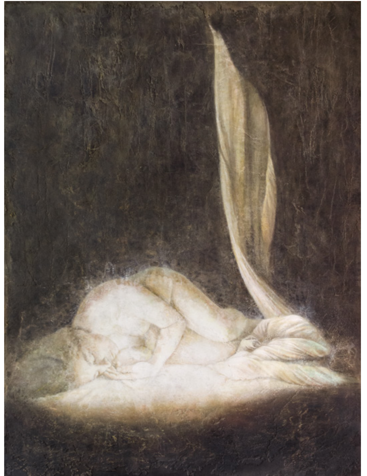
Prima Luce VI , pigmenti di terre ed ossidi su stucco ed affresco / earth pigments and oxides on plaster and fresco, cm. 150x200, 2015