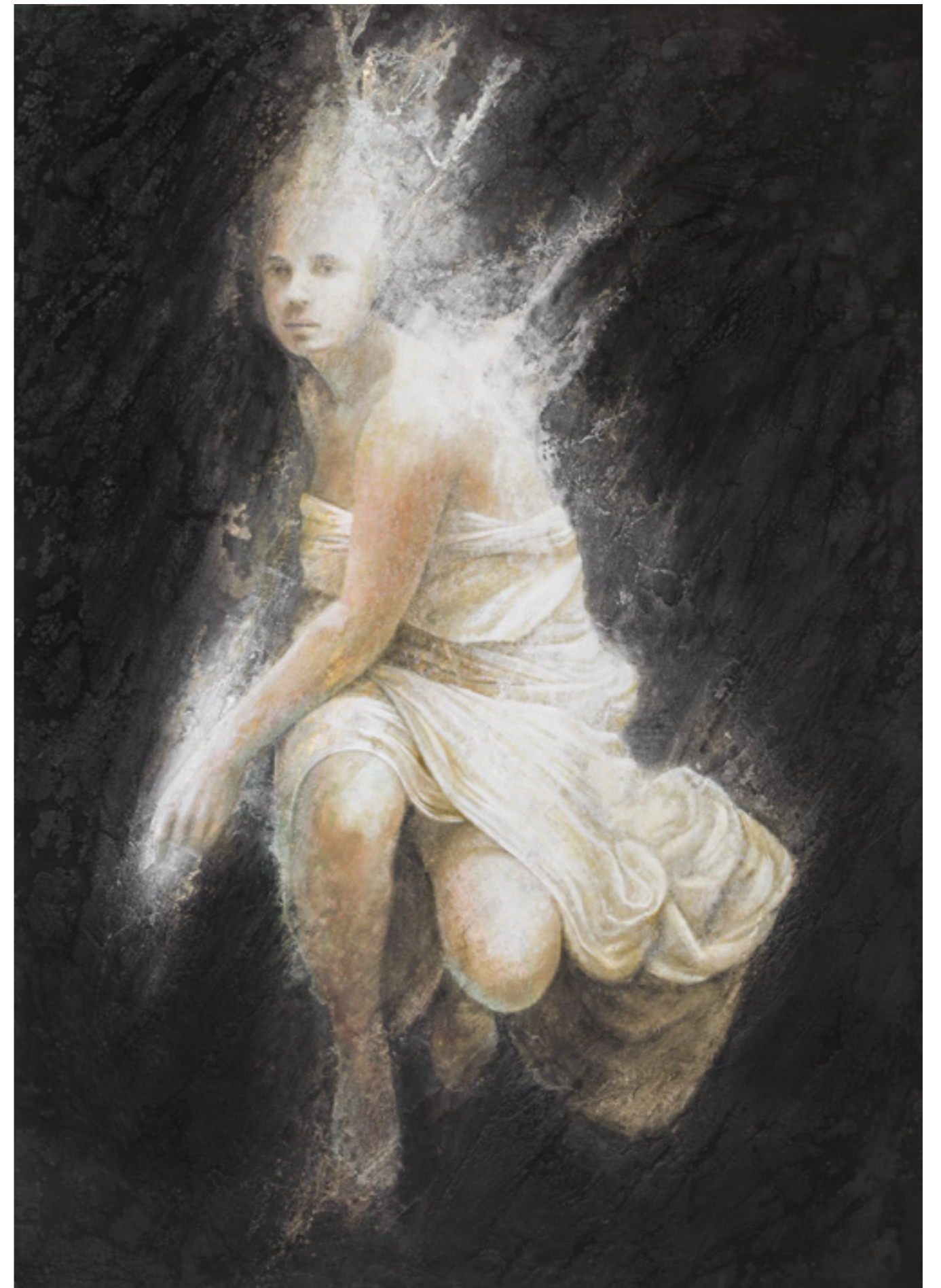
Prima Luce IV , pigmenti di terre ed ossidi su stucco ed affresco / earth pigments and oxides on plaster and fresco, cm. 110x155, 2015