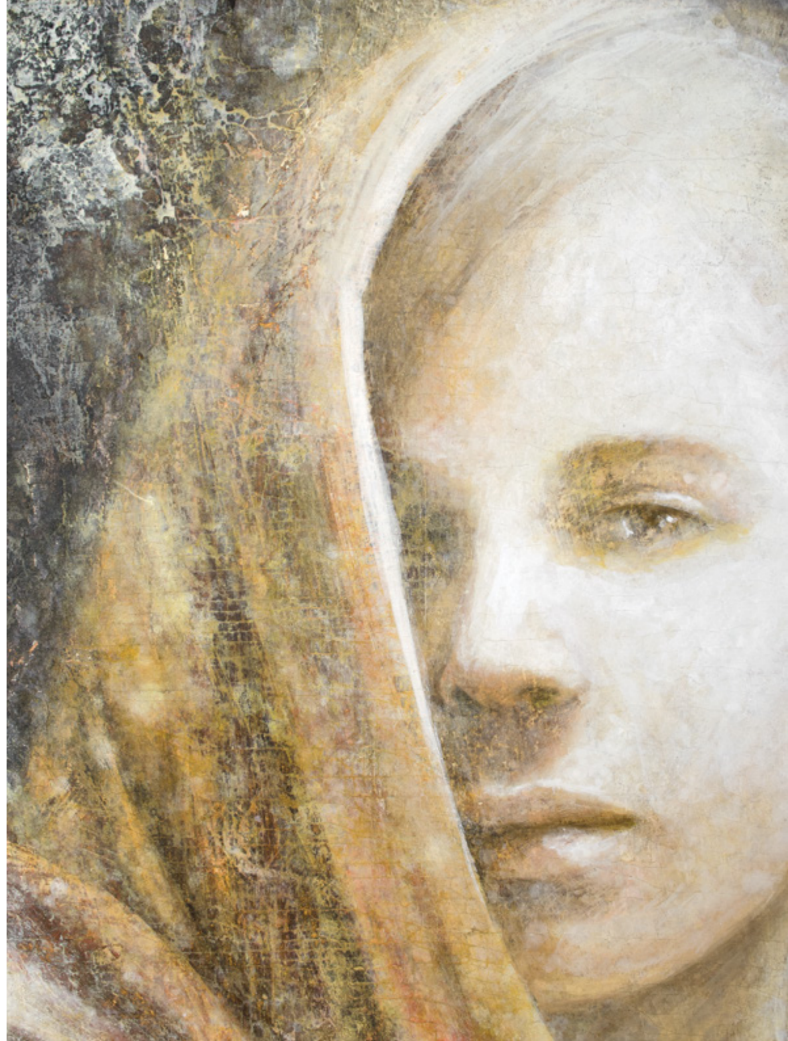
Prima Luce III , pigmenti di terre ed ossidi su stucco ed affresco / earth pigments and oxides on plaster and fresco, cm. 110x150, 2015