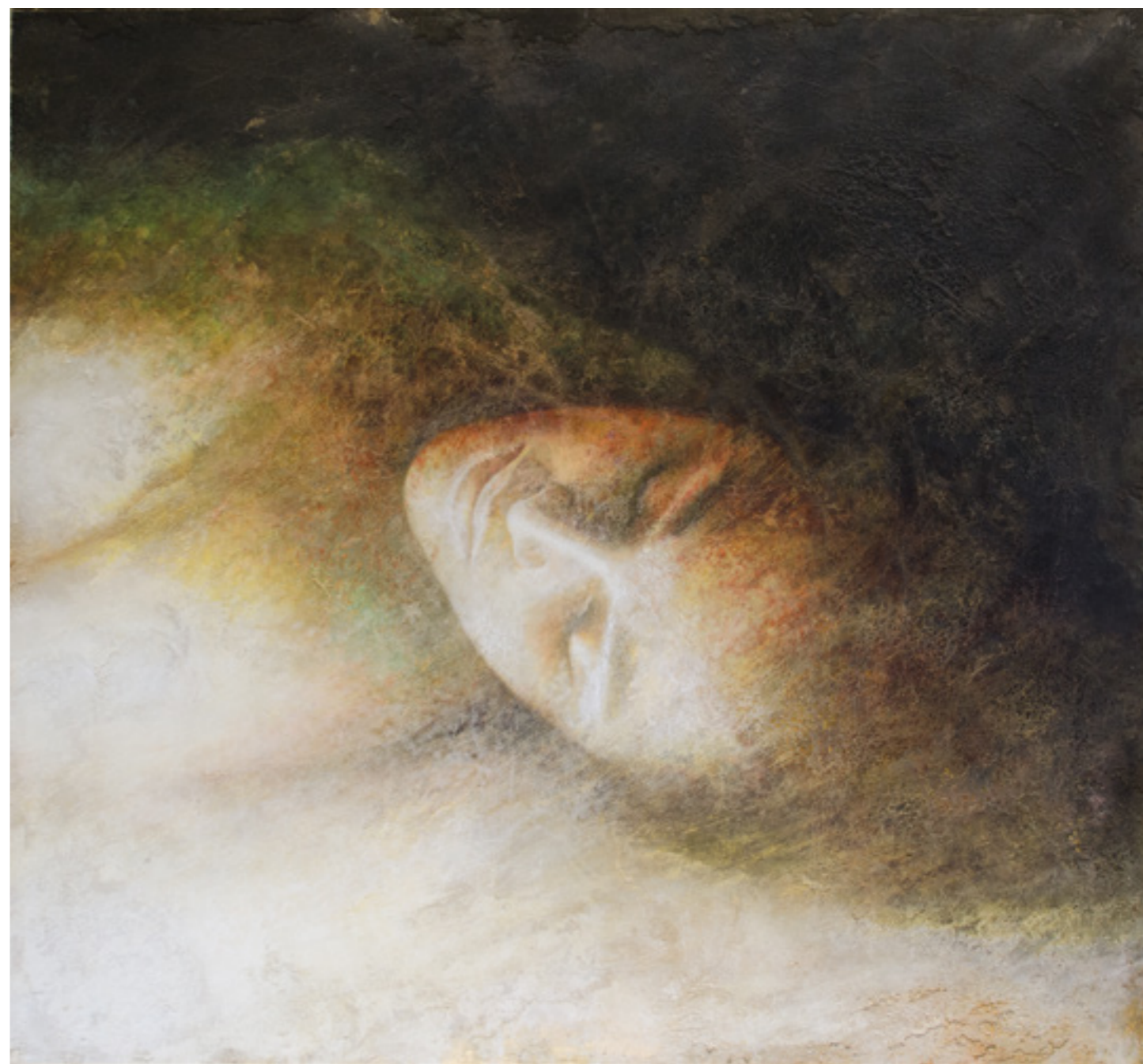
Prima Luce VII , pigmenti di terre ed ossidi su stucco ed affresco / earth pigments and oxides on plaster and fresco, cm. 130x120, 2015