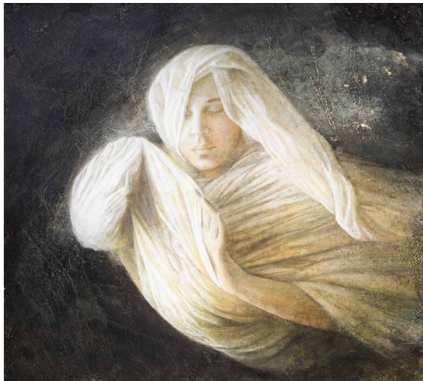
Prima Luce I , pigmenti di terre ed ossidi su stucco ed affresco / earth pigments and oxides on plaster and fresco, cm. 110x90, 2015